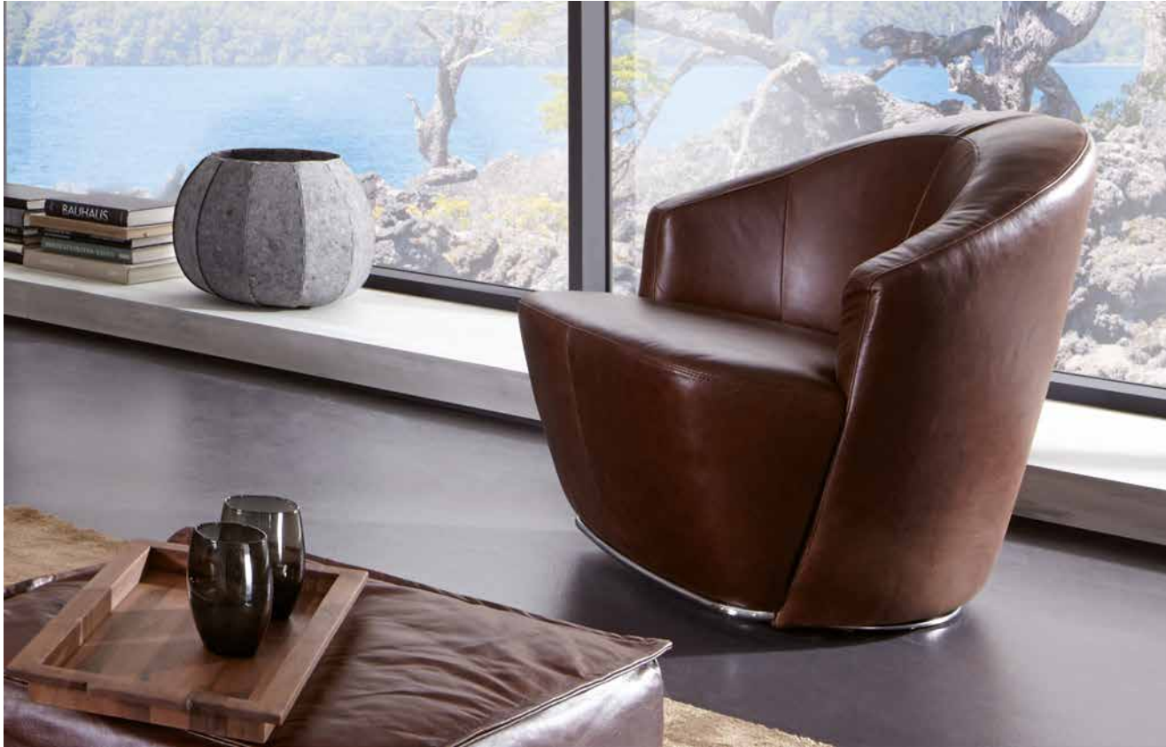
Bezug: Z69/50 cognac